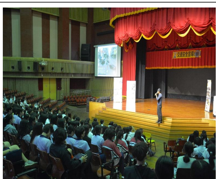
參與學生認真聽講