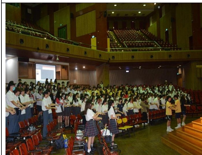
參與學生與講座互動情形