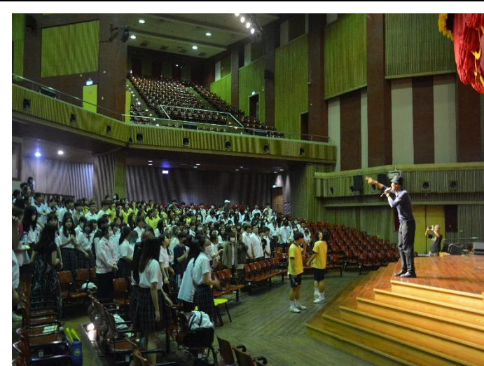
參與學生與講座互動情形