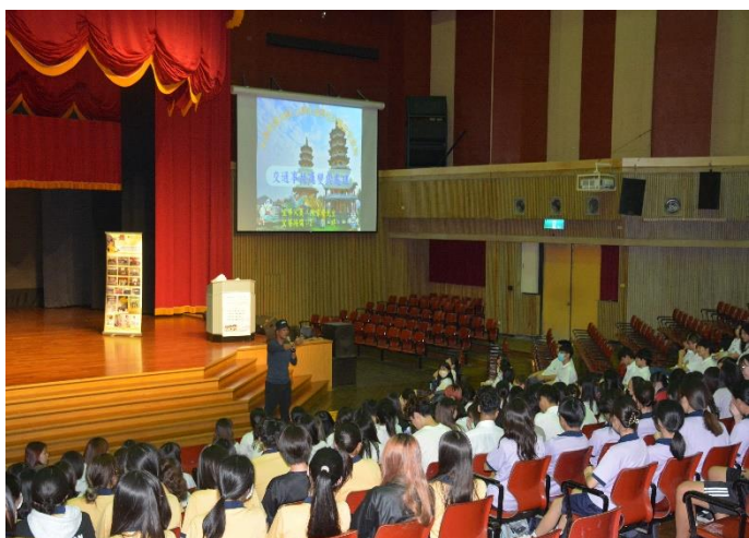
參與學生認真聽講