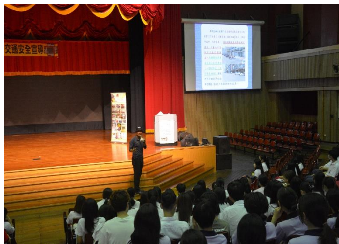
參與學生認真聽講強化學校周邊案例