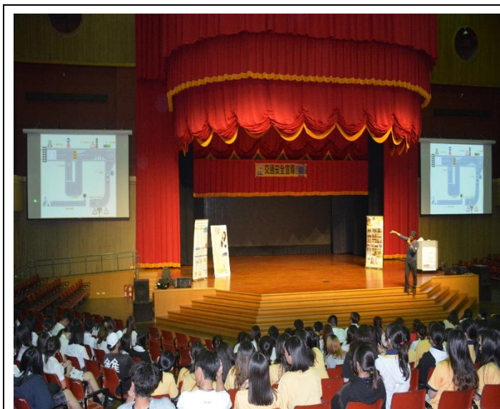
講座以實際案例宣導如何考取駕照