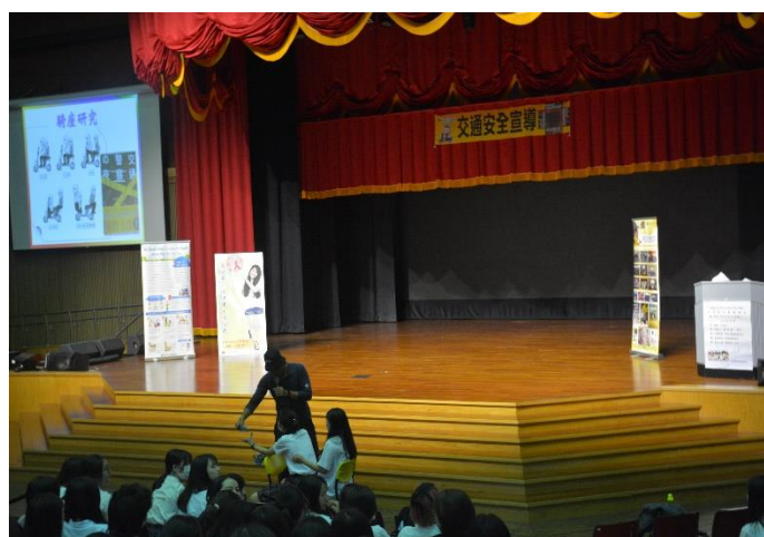
參與學生認真聽講並與講座互動情形