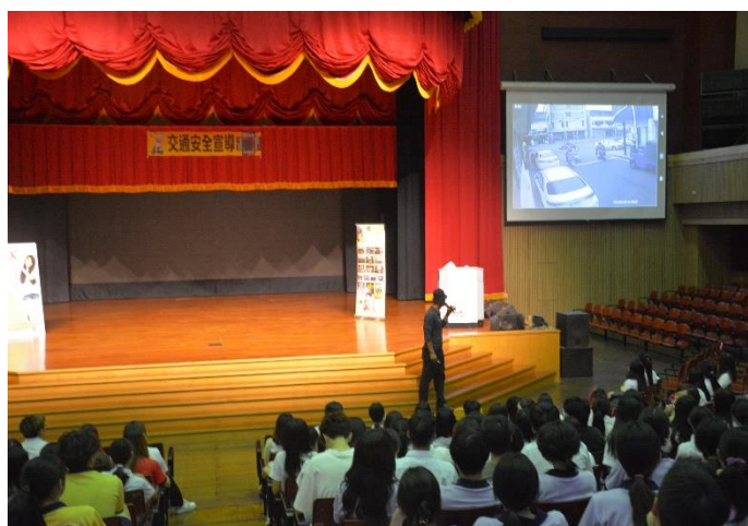
講座以實際案例宣導參與學生認真聽講