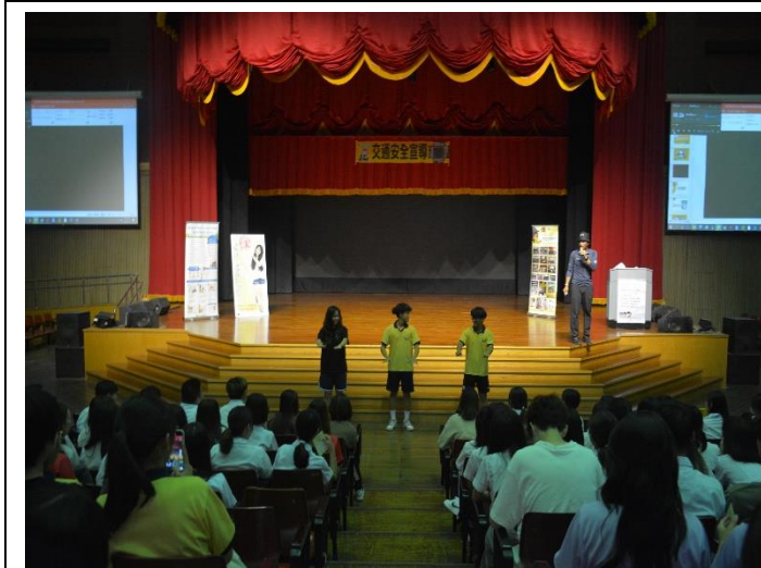
參與學生與講座互動情形