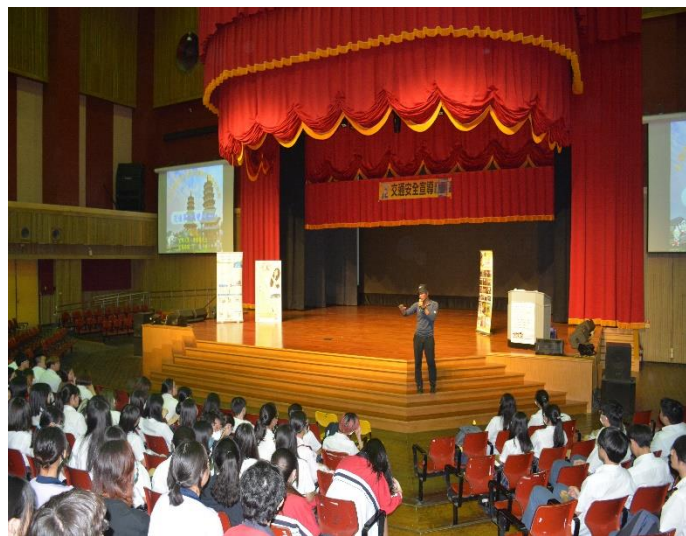
參與學生認真聽講