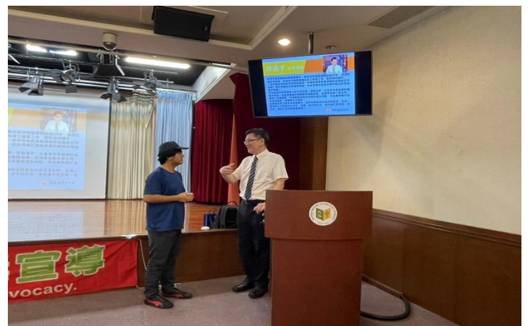
會後境外生同學問題詢問